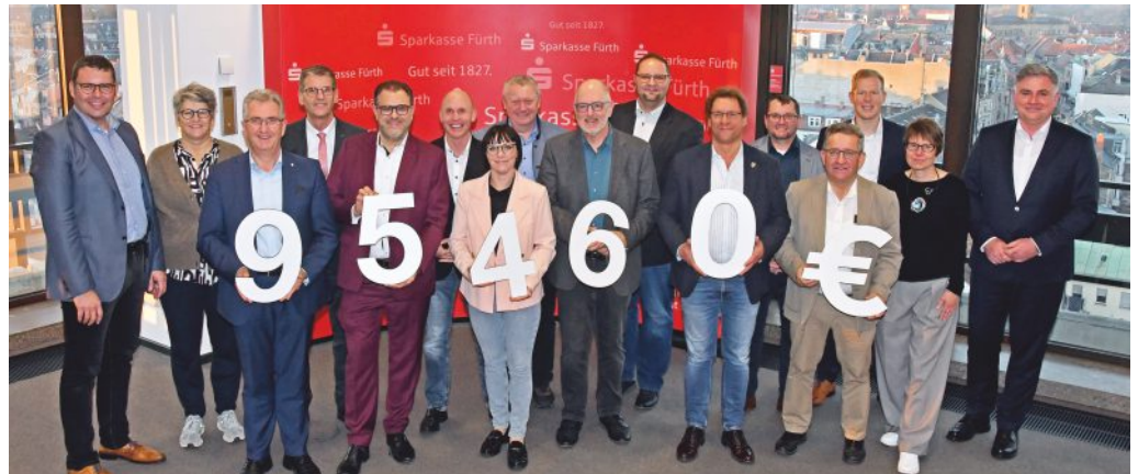
Bürgermeister des Landkreises nahmen die Spenden für Ihre Verein und Organisationen entgegen.

Ein reichhaltiges Vereinswesen sowie ein gutes Netzwerk an sozialen und gemeinnützigen Einrichtungen tragen dazu bei, das Wohlbefinden in der Gesellschaft zu fördern. Neben der wirtschaftlichen ist auch die soziale Teilhabe eine wich-