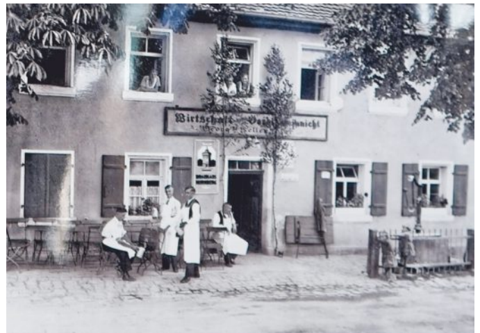
1840 wurde hier der Grundstein für das „Vergißmeinnicht“ gelegt.

lienbetrieb. Es heißt, dass sie bereits als Kinder die Speise- und Getränkekarte auswendig konnten – ein Zeichen für die tiefe Verwurzelung der Familie mit ihrem Gasthof. Das Vergissmeinnicht ist mehr als nur ein Gasthof. Es ist ein Ort mit Seele, ein Stück lebendige Geschichte und ein Symbol für Kontinuität und Vertrauen – gegenüber Gästen, Partnern und der Region.