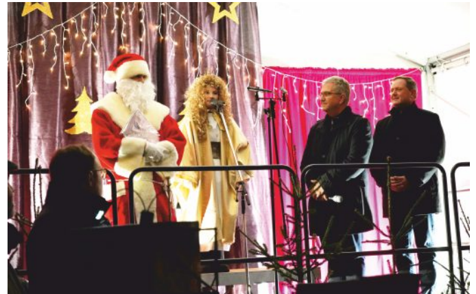
Mit ihrem Prolog eröffnete das Christkind den Weihnachtsmarkt.

Für die musikalische Untermalung des Marktes sorgten die Posaunenchor aus