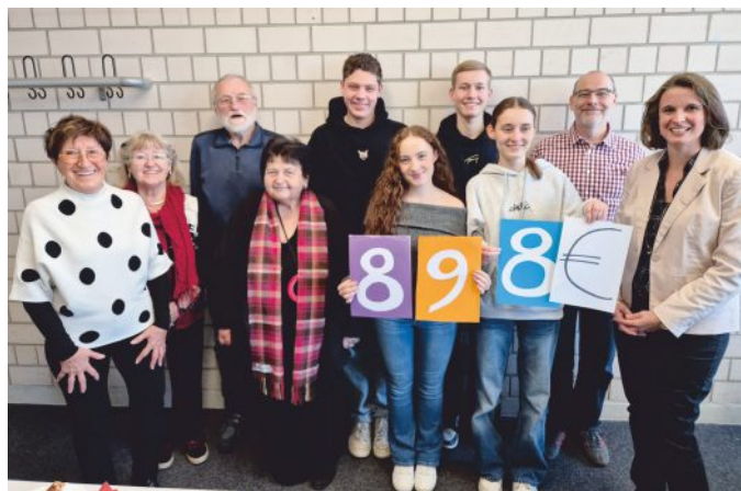
Schülerinnen und Schüler des Gymnasium Stein spenden ihren Arbeitslohn an den Verein Lichtblick e.V.