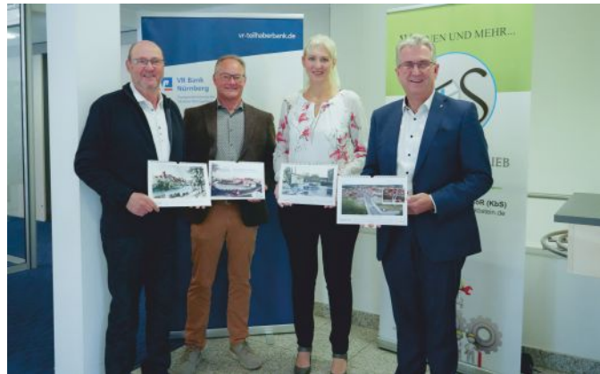
Gemeinsam Brücken bauen. Jeder Kalenderkauf holt ein Stück Stein nach Hause und unterstützt die gute Sache.

Sein besonderer Dank galt dem Kommunalbetrieb Stein, der wie jedes Jahr die Herstellung und den Verkauf