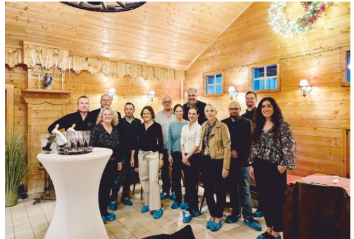
Im Oktober fand das Treffen im Kristall Palm Beach statt.

„Weiches Wasser spart Energie, Reinigungsaufwand, Waschmittel und ist gut für die Geräte sowie Haut & Haar.“