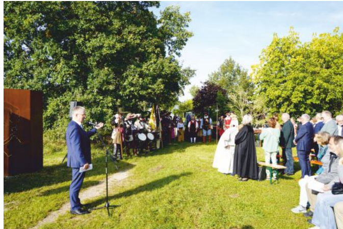
Geschichte zum Anfassen. Das Wallenstein-Festival warf mit einem vielfältigen Programm den Anker in die Vergangenheit.