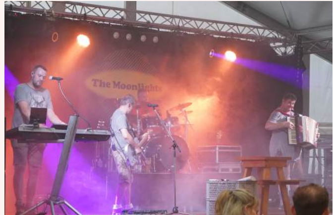
Bieranstich am Freitagabend mit der Band „The Moonlights“

Der Montag steht ganz im Zeichen der Familien. Ab 14 Uhr gelten vergünstigte Preise für alle Attraktionen. Im Festzelt erwarten die Besucher eine Kinderdisco und ein Zauberclown. Ab 19 Uhr sorgt die Band „Die Oberbayern“ für musikalische Unterhaltung, und im Laufe des Abends werden die schönsten Festzugs-