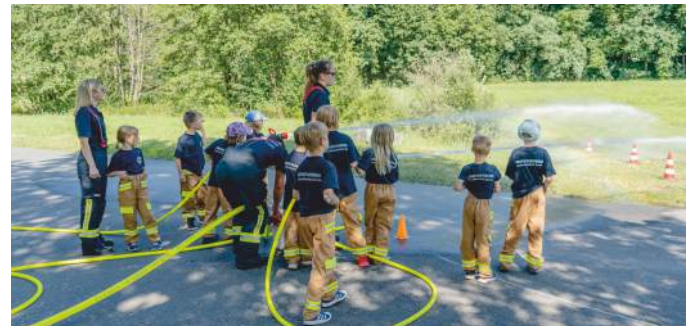
„Wasser Marsch“ hieß es bei der Übung der „Bocha Blaulicht Bande“

erwehrlaute wissen müssen. Aber auch Spiele, Basteln und spannende Ausflüge stehen auf dem Programm. Da die Finanzierung der Kinderfeuerwehr nicht zu den Pflichtaufgaben der Gemeinden gehört, ist sie auf Spenden angewiesen. Unterstützung wird deshalb auch in Zukunft dankbar angenommen, damit unser fantastischer Feuerwehrynachwuchs alles Wichtige für den Schutz der Steiner Bevölkerung lernen kann.