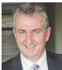
Kurt Krömer Erster Bürgermeister der Stadt Stein