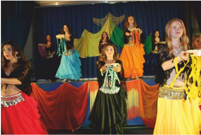
Grazie, Rhythmus und Farbenpracht verzaubern die Sinne

Die beliebte Tanzshow der "Töchter der Wüste" feiert ihr 25-jähriges Bestehen. Präsentiert werden orientalische Tänze von talentierten Tänzerinnen im Alter von 13 bis 34 Jahren.