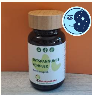
Entspannungskomplex als Schlüssel für Ruhe & Ausgeglichenheit