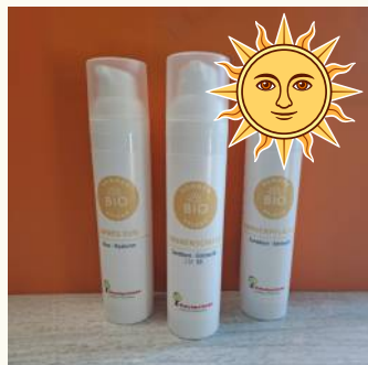
Aus Liebe und Verantwortung für Ihre Haut. Unsere Bio Sonnenpflegeserie.

Die sorgfältige Auswahl und schonende Verarbeitung der Rohstoffe sowie die Verwendung veganer Kapselhüllen aus rein pflanzlichen Quellen gewährleisten den optimalen Schutz empfindlicher Inhaltsstoffe.