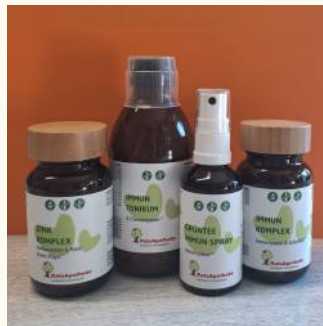
Stärken Sie Ihr Immunsystem – für ein Leben voll Vitalität.