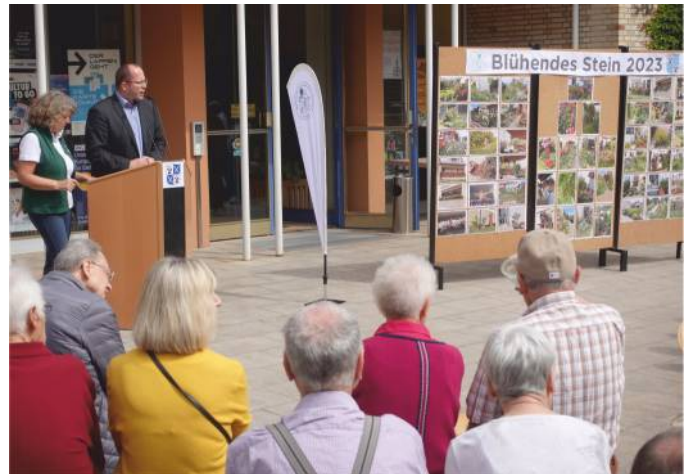
Die Liebe zu Blumen bringt ein leidenschaftliches Spiel aus Farben, Formen und Düften in die Gärten und an die Balkone.

Der Verein für Gartenbau und Landespflege Stein e.V. bot Unterstützung für alle an, die ihren eigenen Garten oder Balkon in ein blühendes Paradies verwandeln möchten. Die Teilnehmenden erhielten für ihre Beteiligung an "Blühendes Stein 2023" einen wunderschönen Oleander als Symbol der Anerkennung und Wertschätzung.